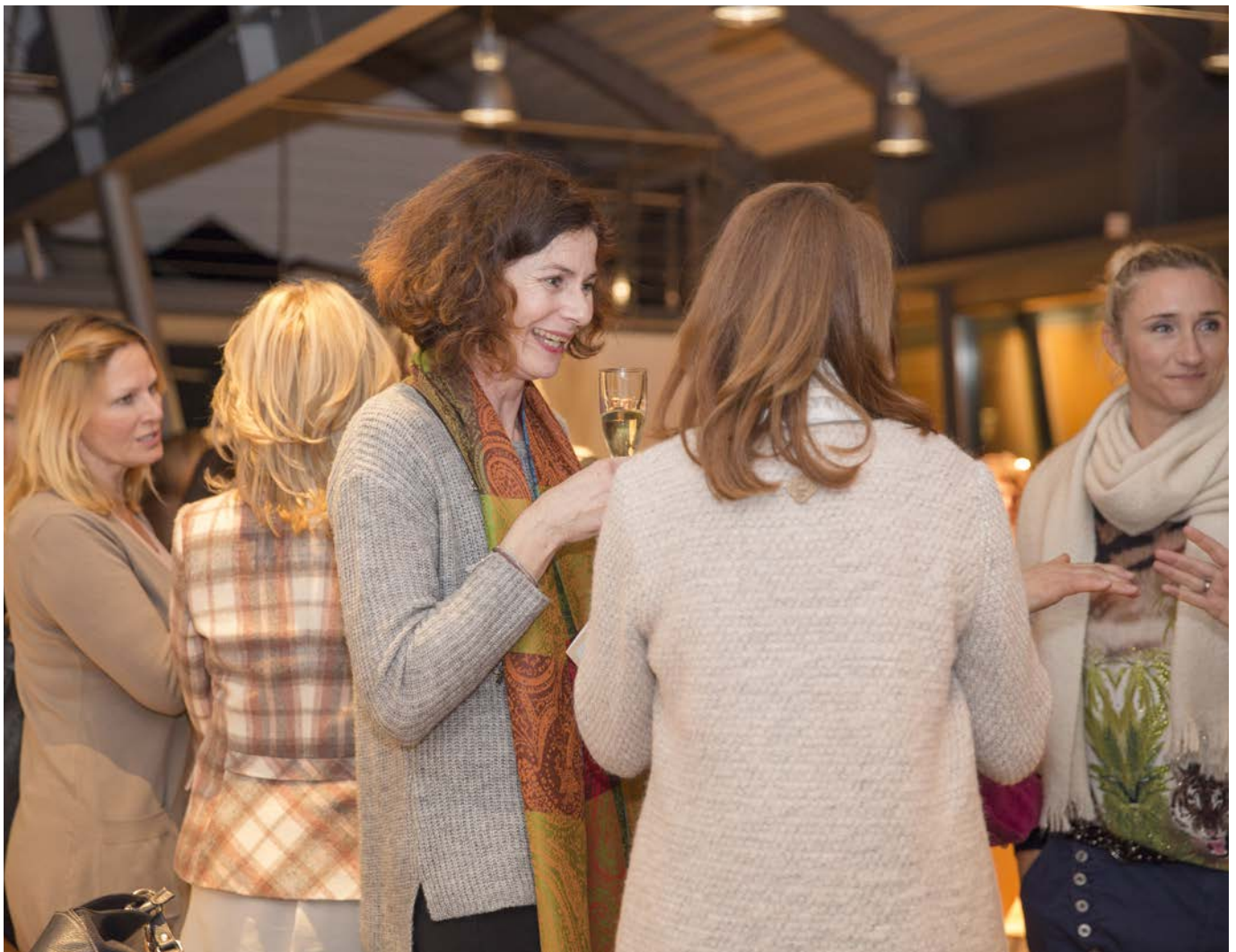
Female Business Seminars schaffen einen Raum für Frauen zum Austauschen und Netzwerken.

machen. Natürlich haben es Männer leichter, da Frauen eher denken, dass vielleicht noch Kinder zwischen die Karrierepläne kommen.